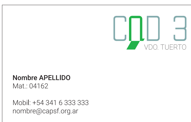
Tarjeta personal: frente y dorso