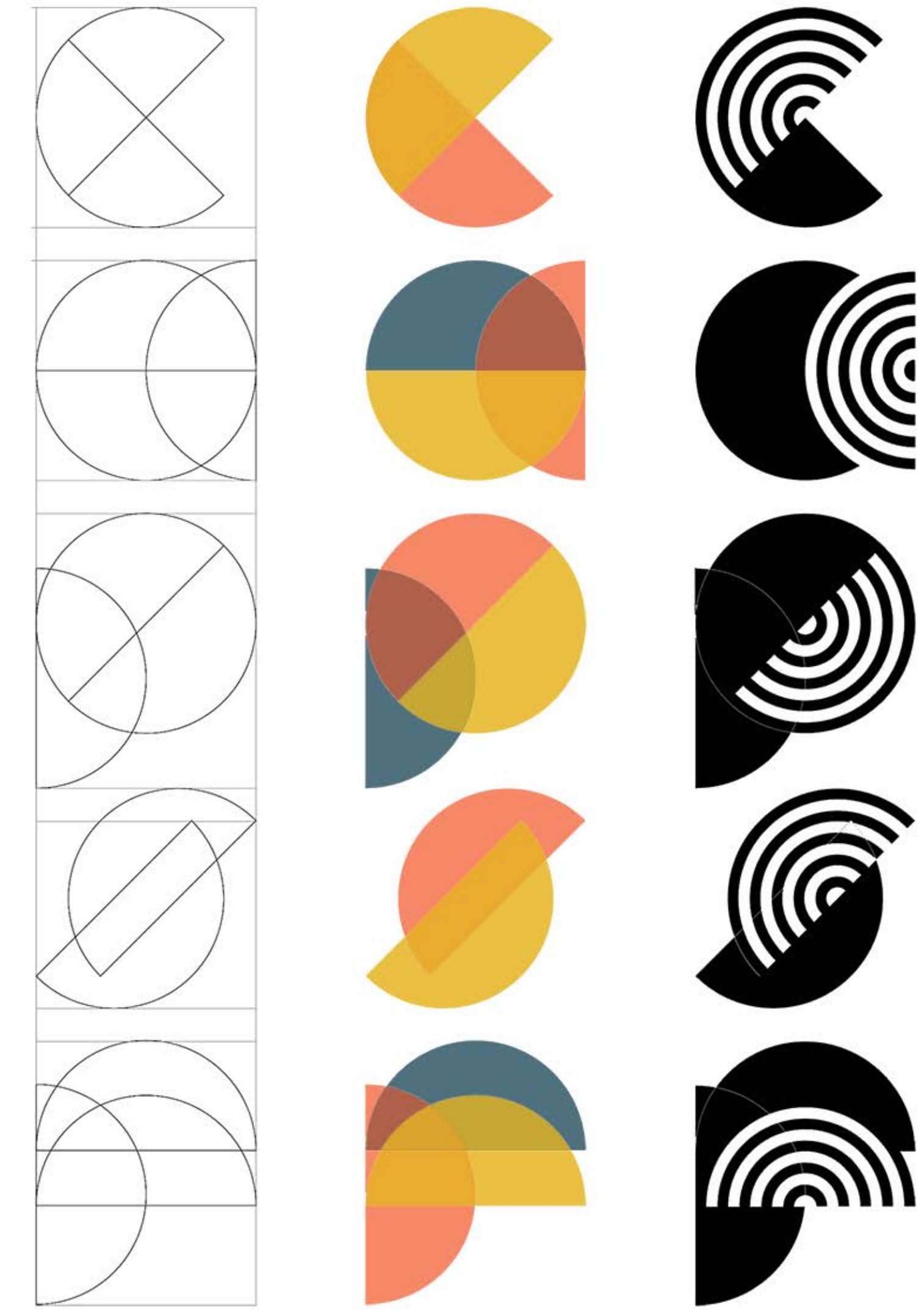
colegio de arquitectos de la provincia de santa fe