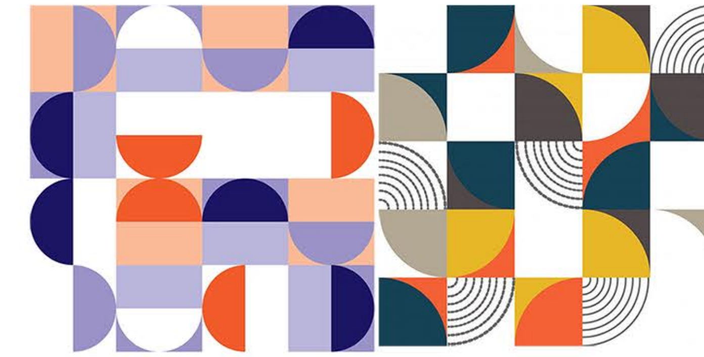
DIAGRAMA DE DISEÑO DE LA BAUHAUS