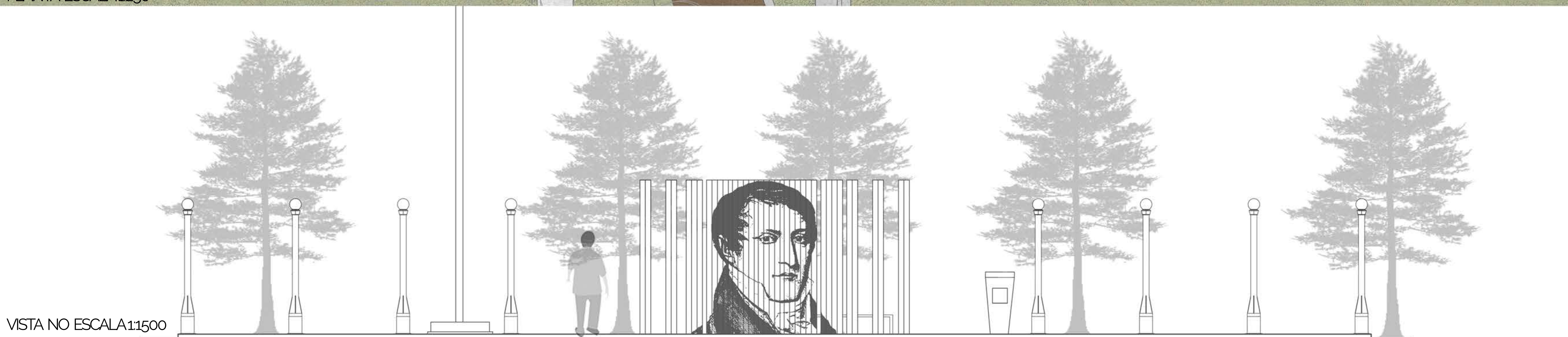
VISTA NO ESCALA 1:1500