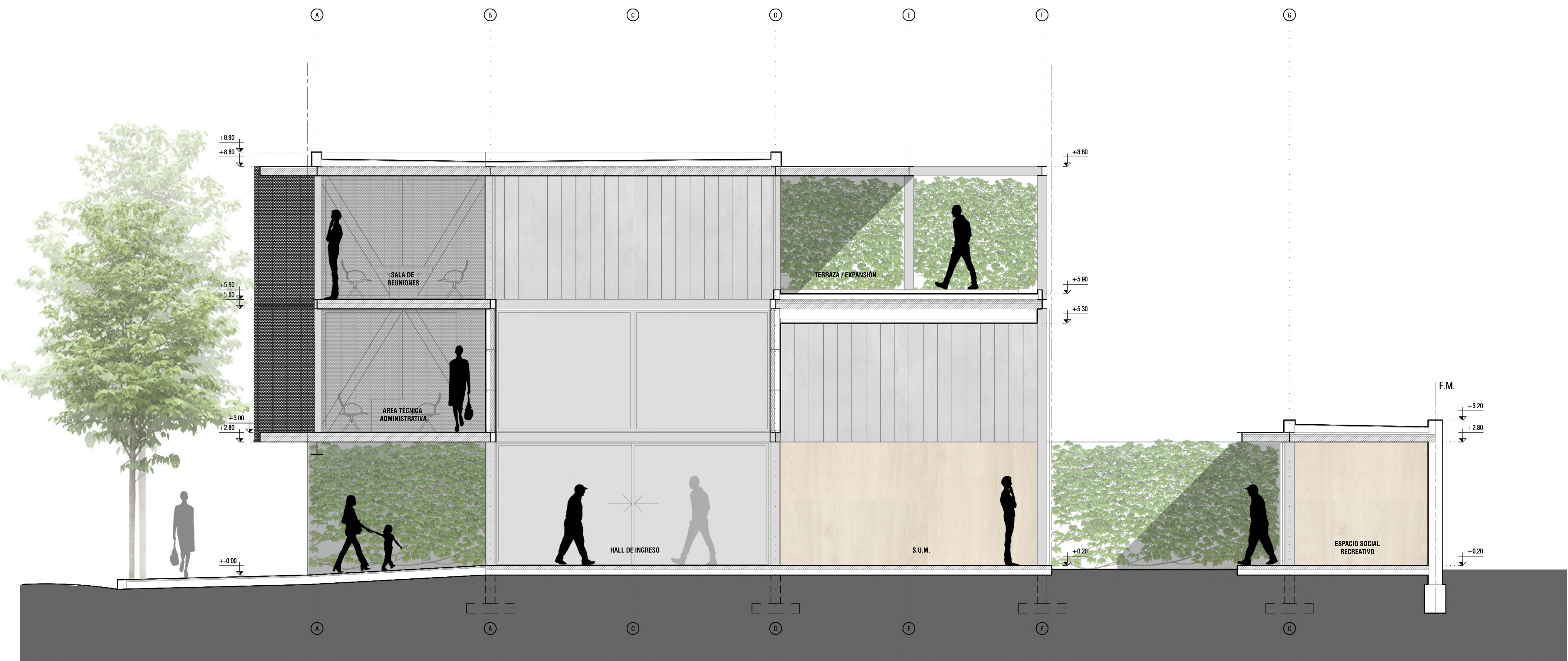
CORTE 1-1 Esc: 1:50