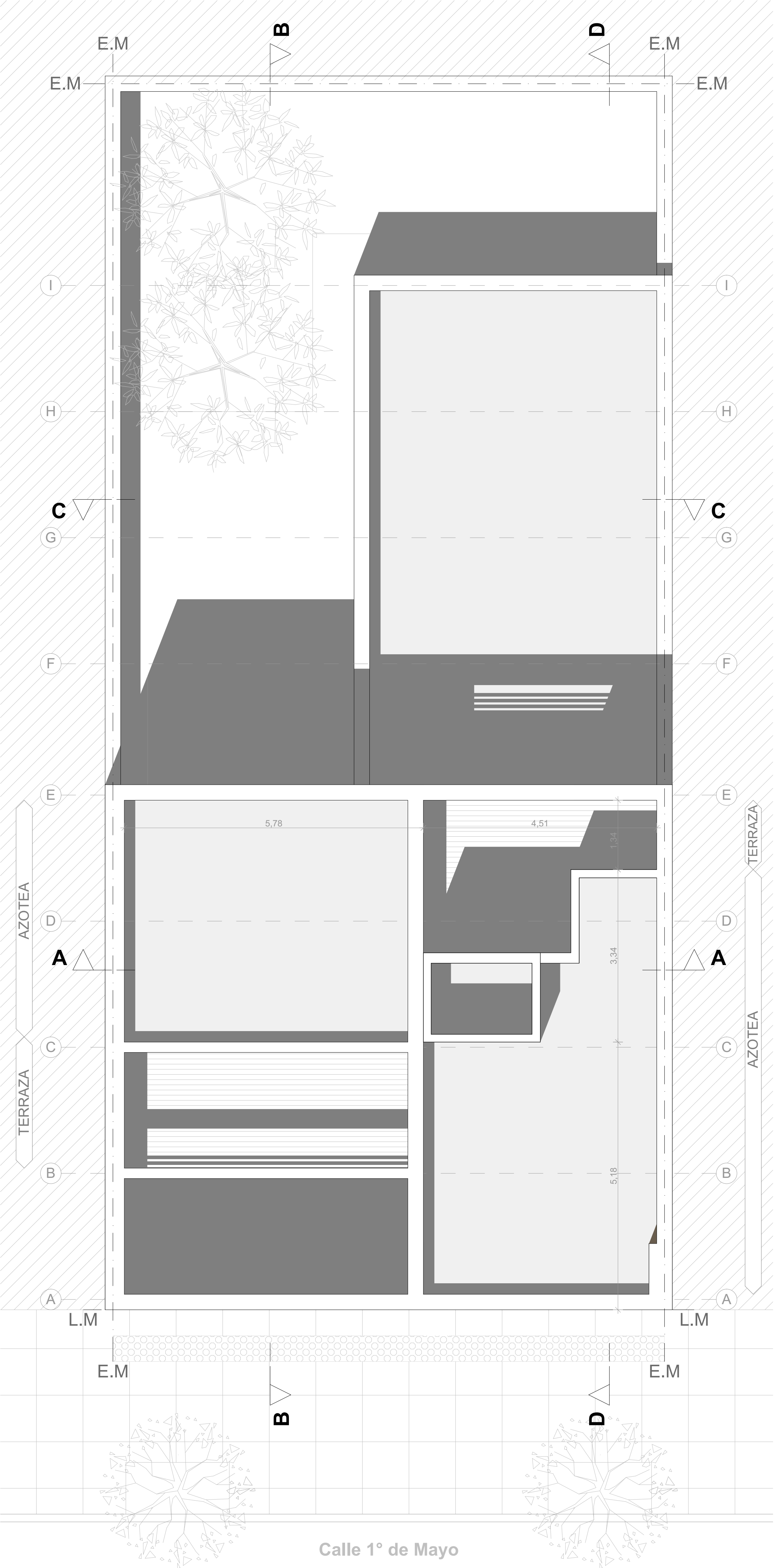
PLANTA DE TECHOS - Esc 1:50

EL TERRENO Se encuentra ubicado sobre la calle 1° de Mayo entre calle Fray Luis Beltrán y calle Remedios de Escalada, Sección B, Manzana 10, parcela 22, de la ciudad de Casilda y consta de las siguientes dimensiones : 10.66 m de frente al oeste por 23.70m de fondo. Dicha terreno cuenta con servicios de agua potable, red cloacal, red de gas natural y energía eléctrica.