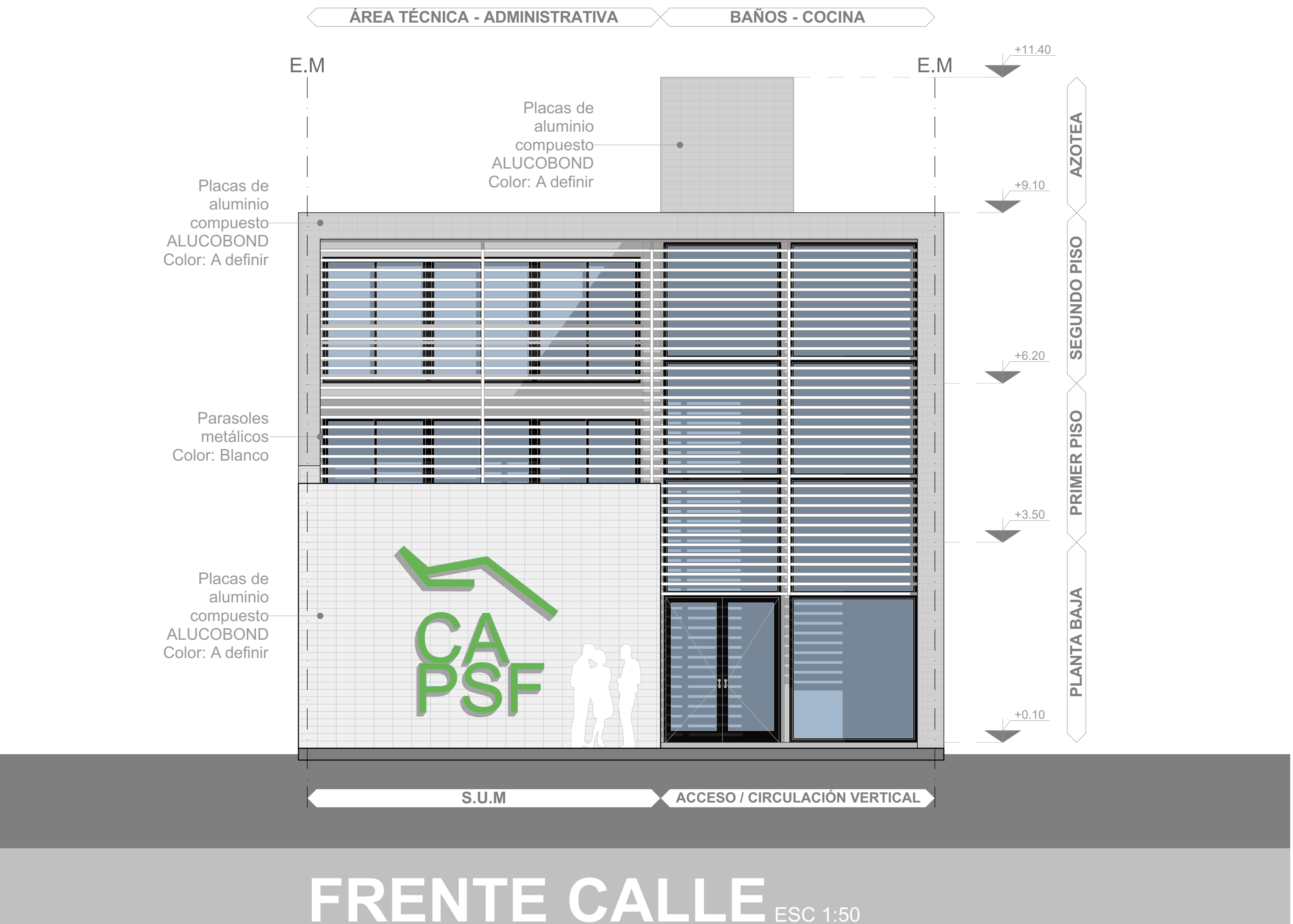
FRENTE CALLE ESC 1:50

EL TERRENO Se encuentra ubicado sobre la calle 1° de Mayo entre calle Fray Luis Beltrán y calle Remedios de Escalada, Sección B, Manzana 10, parcela 22, de la ciudad de Casilda y consta de las siguientes dimensiones : 10.66 m de frente al oeste por 23.70m de fondo. Dicha terreno cuenta con servicios de agua potable, red cloacal, red de gas natural y energía eléctrica.