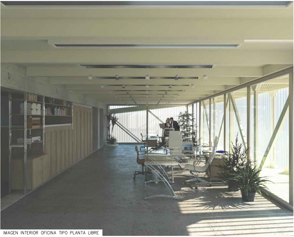
IMAGEN INTERIOR OFICINA TIPO PLANTA LIBRE