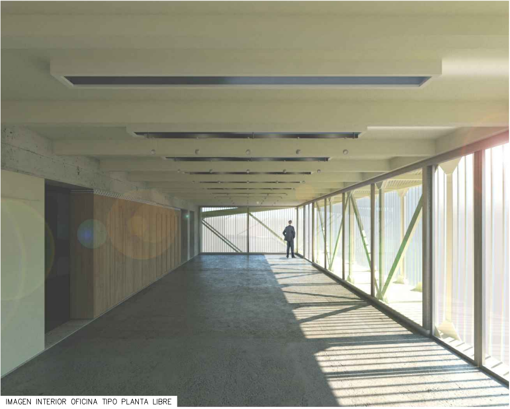
IMAGEN INTERIOR OFICINA TIPO PLANTA LIBRE